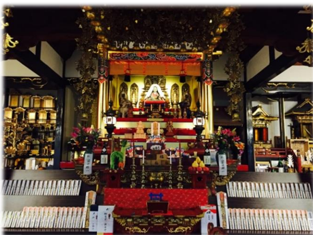
疫病(コロナ)退散守